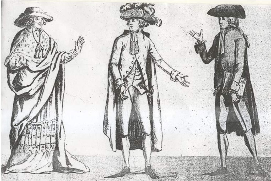
Concepto: “Sociedad del antiguo régimen”

¿A qué estamento social pertenece cada uno de los personajes? Señala en que te basas para tu elección.