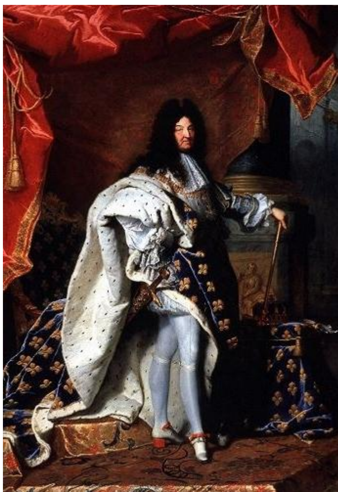
Imagen 1. Luis XIV de Francia.

Observa con atención las siguientes imágenes y responde a las cuestiones que se plantean a continuación de cada una. Usa el espacio que necesites.