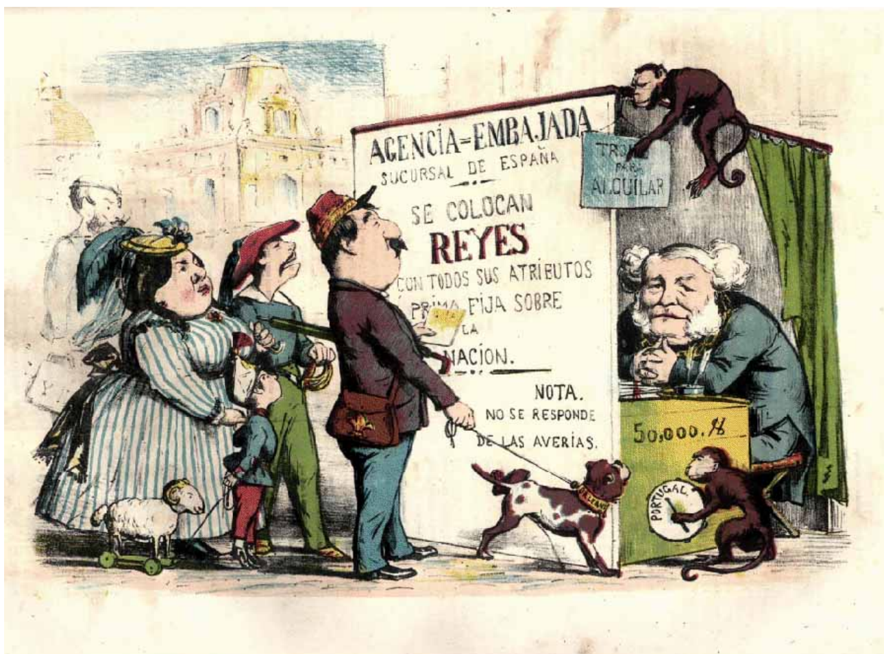
Caricatura de la revista "La Flaca"

Por fin, la elección recayó en Amadeo de Saboya, hijo del rey de Italia, Víctor Manuel , el candidato que causaba menos alteraciones en el juego de las alianzas internacionales. La "salida italiana" ofrecía garantías de pureza liberal: los Saboya, dinastía unificadora de Italia, no estaban contaminados de autoritarismo y además ofrecían una posibilidad de contención frente a los republicanos. Prim apostó decididamente por esa solución y consiguió que las Cortes nombrasen rey a Amadeo de Saboya por 191 votos contra 120. Escaso apoyo para asunto tan problemático.